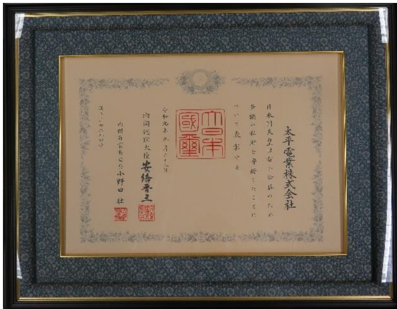
▲当社に贈られた紺綬褒章